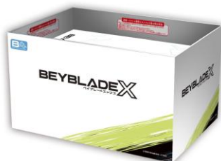
【公式スタジアム什器】